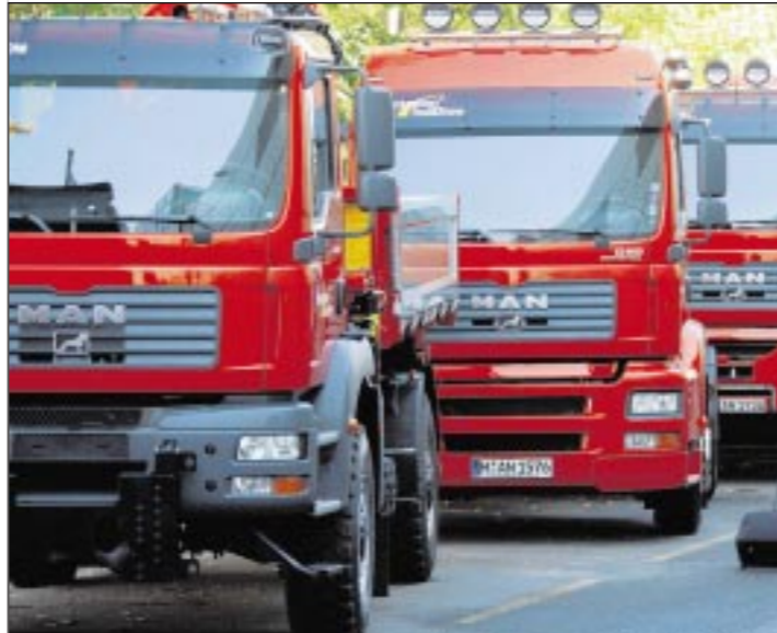
Lastwagen von MAN sind derzeit gefragt.